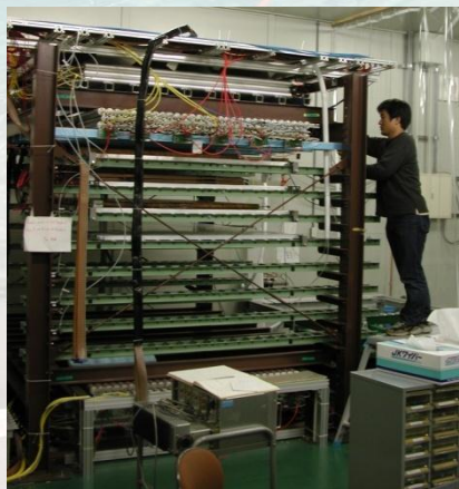
神戸大での宇宙線を使った全数検査