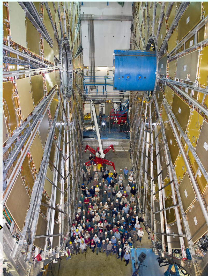
地下実験場でのアトラス測定器へ 組み込み (2006-2008年)